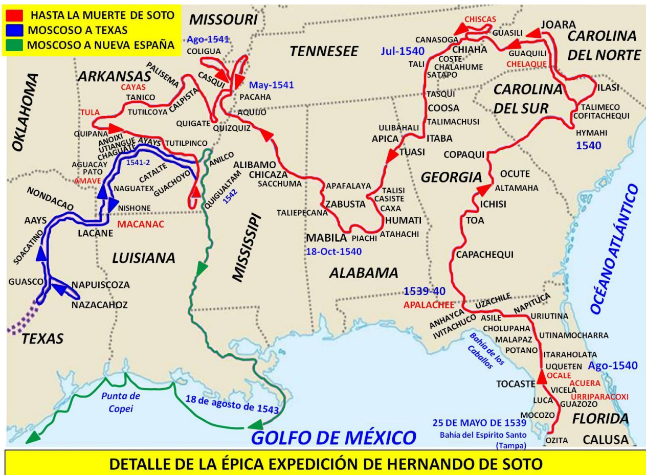
DETALLE DE LA ÉPICA EXPEDICIÓN DE HERNANDO DE SOTO